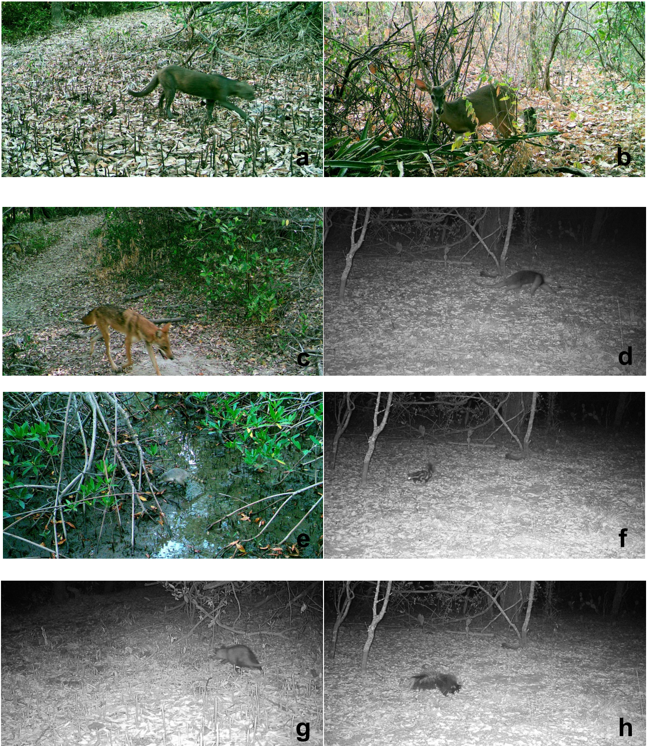
Figura 2. Imágenes de los mamíferos registrados en diferentes sitios del bosque de Mangle y bosque seco, en la Bahía de Chismuyo: (a) gato de monte Herpailurus yagouaroundi , (b) venado cola blanca Odocoileus virginianus , (c) coyote Canis latrans , (d) oso hormiguero Tamandua mexicana , (e) mapache Procyon lotor , (f) zorrillo bandedo Spilogale angustifrons , (g) guazalo Didelphis virginiana , (h) zorrillo Mephitis macroura .